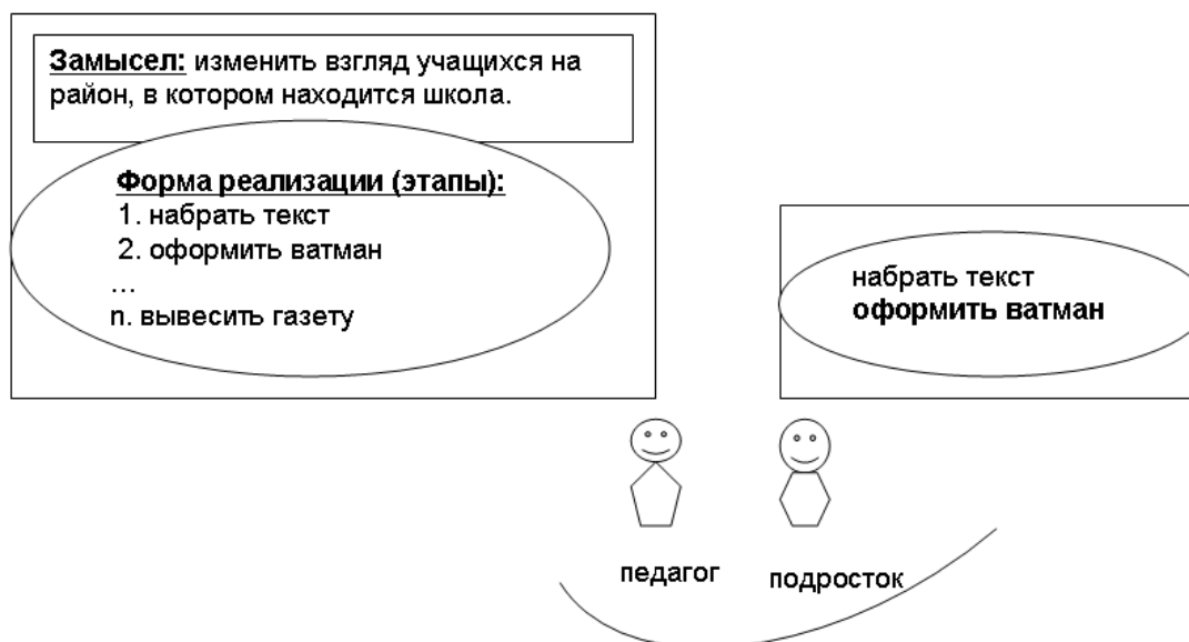
Рис. 3. Различие в представлении цели педагогом и подростком.

Анализ особенностей цели. Цель в данном случае у ученицы не сформировалась, так как не было осознания ни норм, ни ценностей, ни анализа ситуации, ни осознания социального целого. Ученица включилась в изготовление стенгазеты, поскольку ее интересовал один из этапов производства (рис. 3).