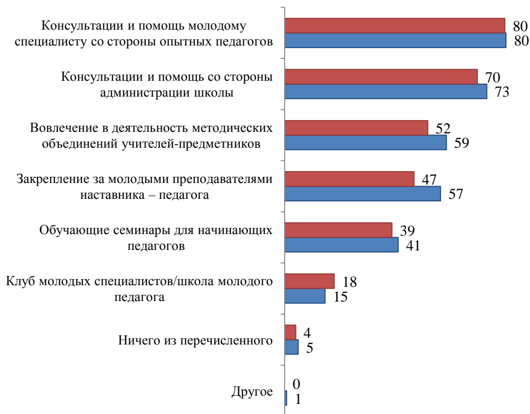
Рис. 3. Включенность начинающих педагогов в систему профессионального сопровождения (процент от опрошенных молодых педагогов):

■ – существуют в школе; ■ – участвовали молодые педагоги. Вопрос начинающим педагогам: «Укажите, пожалуйста, какие формы поддержки начинающих педагогов существуют в вашей школе и в каких из них участвовали вы?»