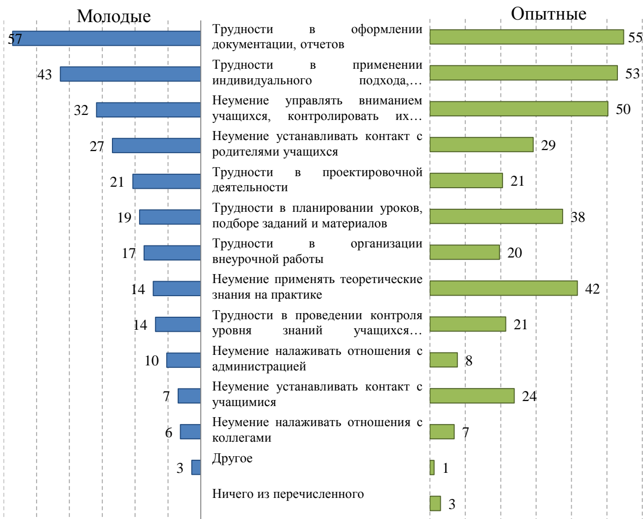
Рис. 1. Трудности, возникающие у молодых педагогов в процессе адаптации к профессиональной деятельности (по мнению самих молодых педагогов и их опытных коллег; %). Вопрос молодым педагогам: «С какими трудностями вы сталкиваетесь/столкивались в начале профессиональной деятельности?» Вопрос опытным педагогам: «С какими трудностями сталкиваются молодые педагоги в начале профессиональной деятельности (в вашей школе)?»

значительно чаще фиксировали проблемы в работе своих молодых коллег, чем начинающие диагностировали их у себя. Это в первую очередь касается «неумения управлять вниманием учащихся, контролировать их поведение» (50 % среди опытных против 32 % среди начинающих), «неумения применять теоретические знания на практике» (42 % против 14 % соответственно), «трудностей в планировании уроков, подборе задания и материалов» (38 % и 19 %), «установления контактов с учащимися» (24 % и 7 %).