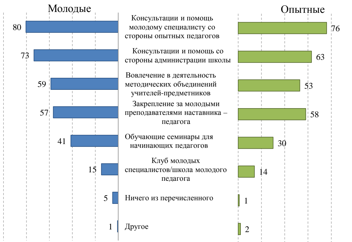
Рис. 2. Основные формы поддержки молодых педагогов (по мнению молодых педагогов и их опытных коллег; %). Вопрос начинающим педагогам: «Укажите, пожалуйста, какие формы поддержки начинающих педагогов существуют в вашей школе?» Вопрос опытным педагогам: «Укажите, пожалуйста, какие формы взаимодействия с молодыми педагогами существуют в вашей школе?»

Степень участия начинающих педагогов в обозначенных формах профессиональной поддержки в целом совпадает с предоставленными в школе возможностями, но по некоторым аспектам различается. Например, такие формы поддержки, как «закрепление за молодым преподавателем наставника» и «вовлечение в деятельность методических объединений учителей-предметников», в школе созданы, но современные молодые специалисты ими пользуются не всегда (рис. 3).